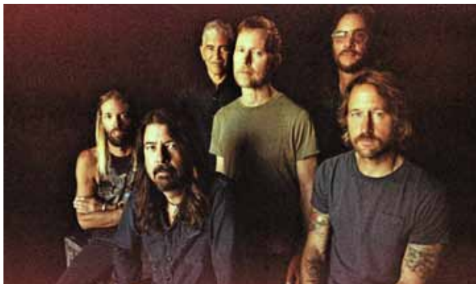
Die Foo Fighters haben für ihr zehntes Studioalbum neue Sounds ausprobiert.

Sobald es wieder möglich ist, will Grohl alles nachholen. „Wenn mir jemand ein Flugticket für die nächste Tour gibt, werde ich zum Flughafen rennen, ich werde zur Bühne rennen“, sagt er. Und wenn im Konzert die ersten Takte von „Making A Fire“ oder „No Son of Mine“ erklingen, wird es manchem Fan vielleicht so gehen wie Dave Grohl persönlich, als er die neuen Songs nach den Aufnahmen erstmals gehört hat. „Wir haben uns angeguckt und gesagt: Das sind die Foo Fighters? Heilige Scheiße, das ist verdammt noch mal verrückt!“